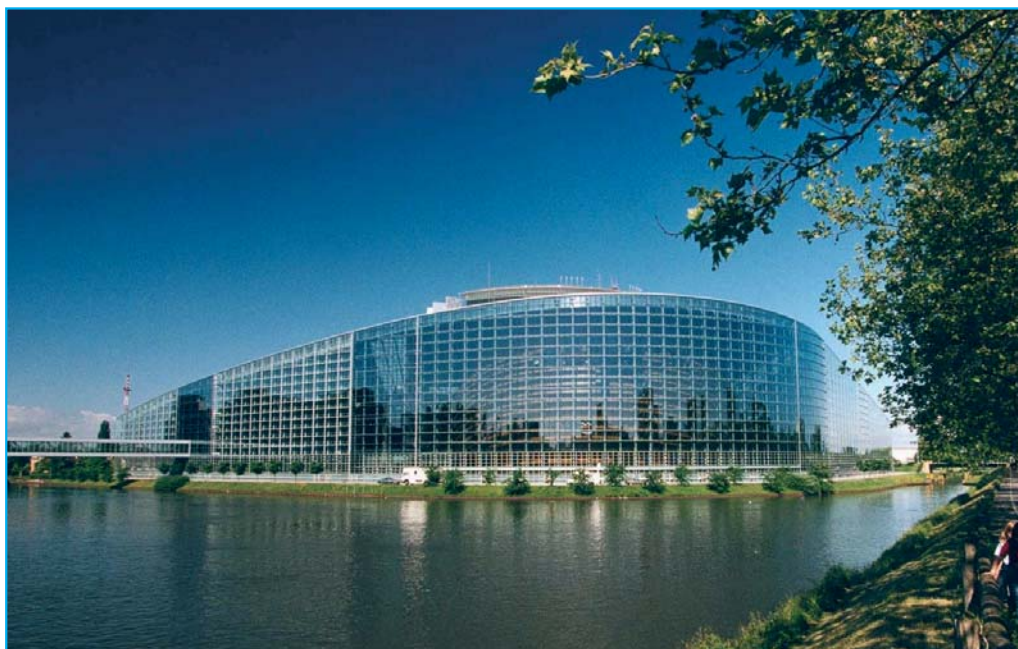
La sede del Parlamento europeo a Strasburgo.

sante, importanti linee di finanziamento comunitarie (come il “Programma Quadro per le Ricerca”) e fondi (si pensi al Fondo Sociale Europeo) possono e debbono essere meglio utilizzati, concentrando le risorse su alcuni progetti significativi (le Università sono spinte in questo senso proprio dalla nuova impostazione del Programma quadro). Perché non creare davvero una rete di Scuole Tecniche Superiori, ben inserite nei nostri distretti (o sistemi produttivi locali, che dir si voglia), anziché disperdere i fondi del FSE in mille rivoli? Mentre sul piano dell’innovazione tecnologico qualcosa si è messo nella giusta direzione (l’esempio è quello del PRITT voluto dalla nostra Regione), su quello della Formazione professionale i margini di miglioramento sono, a dir poco, colossali”.